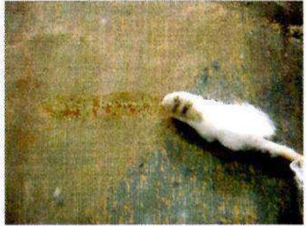
Test de décrassage au tri-citrate d'ammonium

a) Test mécanique : 1) A la gomme wishab : sans effet