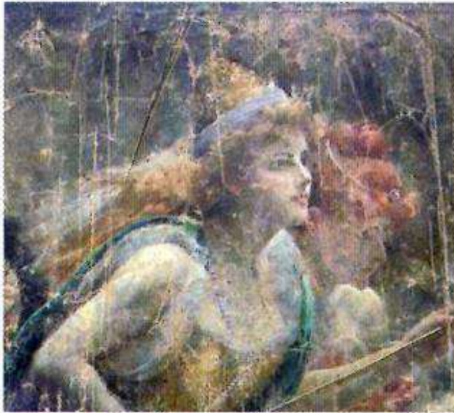
Avant première retouche

Le choix de la technique de l'aquarelle s'est fait en raison de sa transparence, donc de sa légèreté. Les pigments utilisés sont des terres ou des pigments stables selon la palette préconisée par l'Institut supérieur de conservation et restauration de Rome :