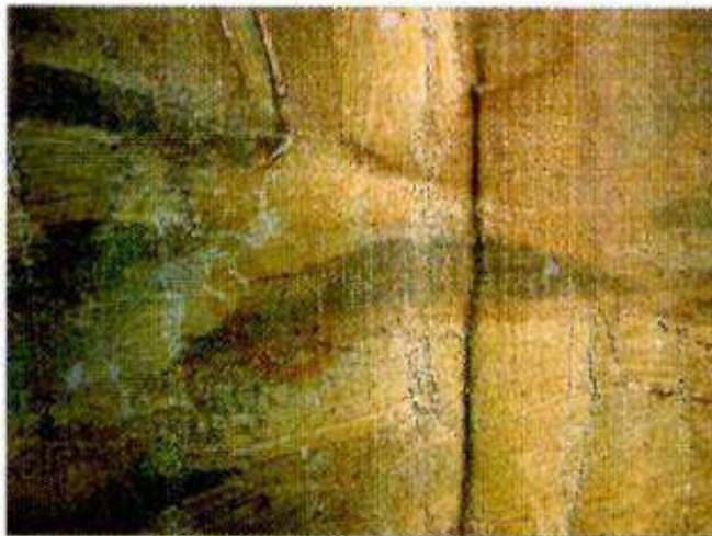
Détail du vernis inégal

L'ensemble de la couche picturale est recouvert d'un vernis jauni et irrégulier avec des zones de blanchiments et parfois de faible adhérence entre la couche picturale et le support de toile :