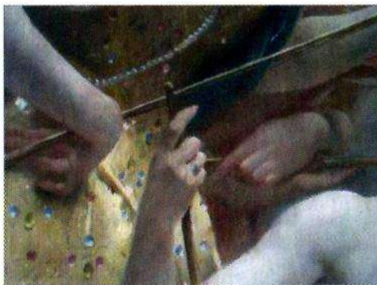
Mains après restauration