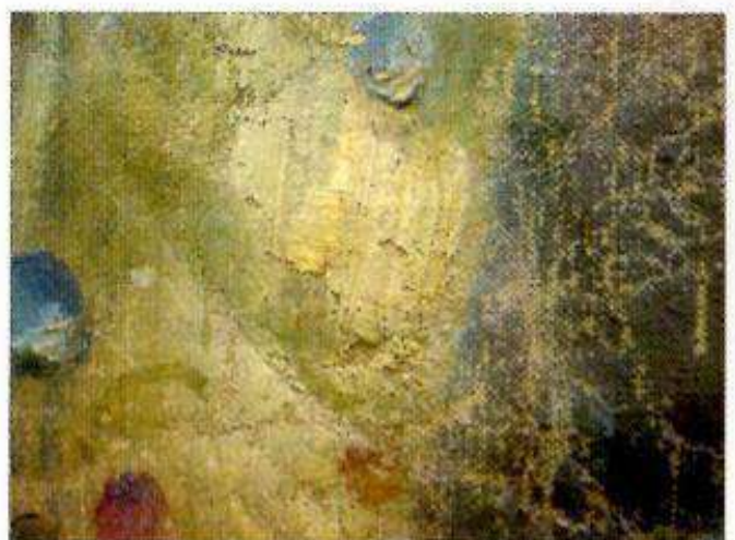
Détail des lacunes dans la robe de la fée