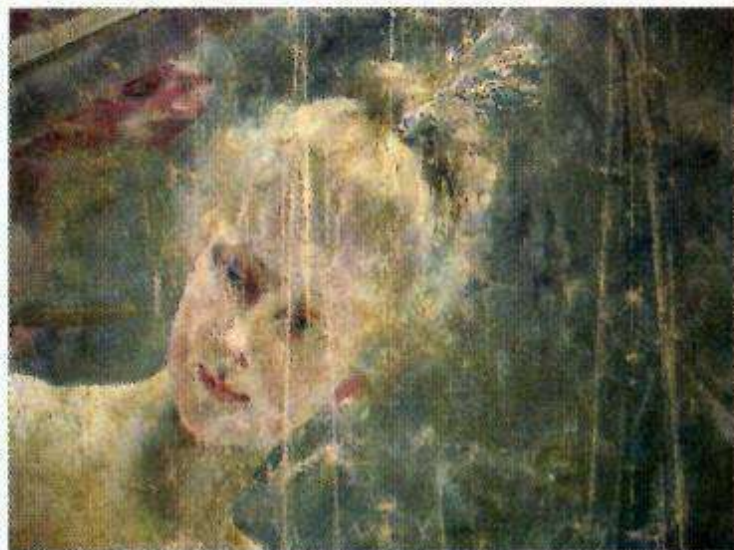
Tête de fée avant restauration