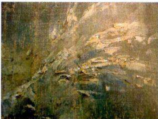
Détail des empâtements de la houppette de la fée