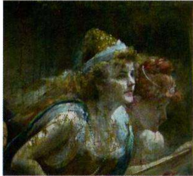
Après vernissage de la première retouche

Cependant l'aquarelle étant transparente ne permet pas de couvrir les points foncés, pour cette raison, après le passage d'un vernis à retoucher, isolant le mastic et la retouche, une deuxième retouche au vernis ( type Maimeri) est nécessaire :