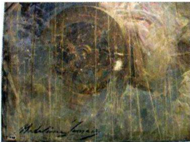
Signature avant restauration