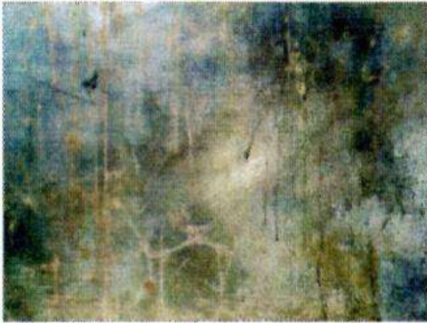
Détail de l'encrassement de la surface