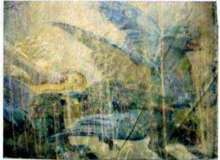
Détail des plis et des lacunes

L'ensemble de la couche picturale est recouvert d'un vernis jauni et irrégulier avec des zones de blanchiments et parfois de faible adhérence entre la couche picturale et le support de toile :