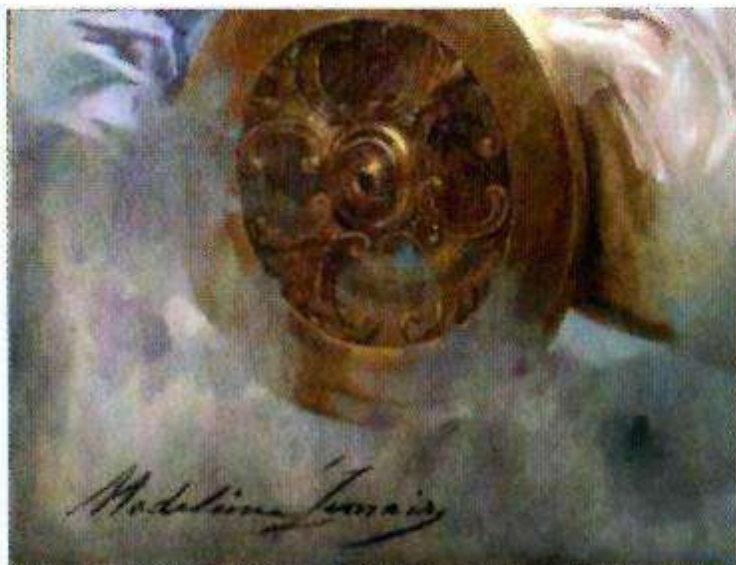
Signature après restauration