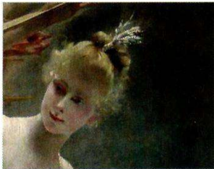
Tête de fée après restauration