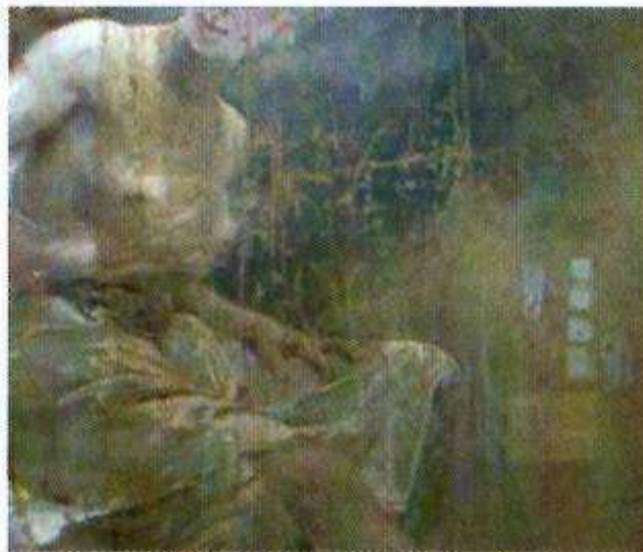
Tests d'allègement du vernis

Les gels agissent bien, cependant la couche de vernis étant très inégale, le contrôle de l'allègement se fait plus sûrement au bâtonnet en insistant sur les zones plus épaisses avec de l'éthanol pur :