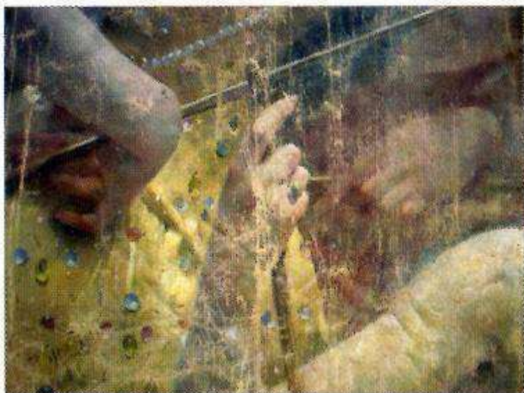
Mains avant restauration